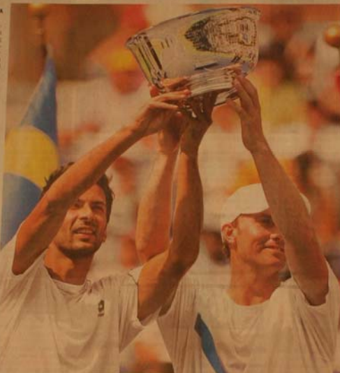
Schaut her, der gehört uns. Julian Knowle (links) und sein Doppelpartner Simon Aspelin stehen gemeinsam im Siegerpark der US Open.

Muster war die Nummer eins der Welt. Denkst du, das geht in deinem Doppelt zu sein? Hinterher ist, dass wir uns gut einschätzen können. Wir wollen uns vorerst in den Top-Ten etablieren. Aber hier hätte prägnant, dass wir uns habende dort sehen!