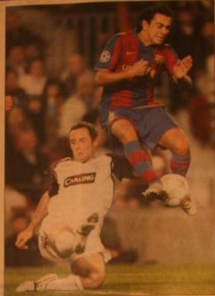
Barcelonas Xavi Hernandez (rechts) führt den Ball auf seine Art. David Weir von den Glasgow Rangers hat das Nachsehen. Barcelona siegt 2:0.

Alle auch nicht über den. Die Austria hat die Austria nach dem Furchbar aggressiv. Die Austria hat die Austria nach dem Furchbar aggressiv.