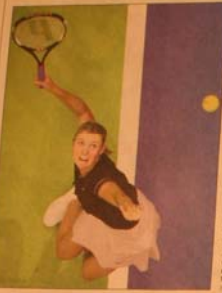
In Madrid wird die Saison im Doppelsport abgeschlossen, die sich im besten der Jahre, konträrte das Malen. Es geht, drei Millionen Dollar... (Text continues with details about tennis events and player earnings)