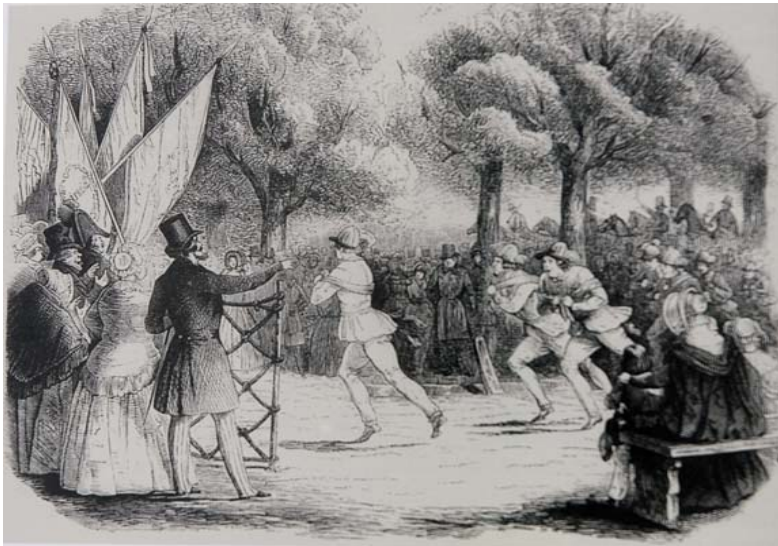
Abb.: 1822 verlegte man die Probeläufe als öffentliche Schauveranstaltung in den Prater.

sie mussten „neben dem Wagen oder Pferde des Herrn laufen, und so stark als Pferde rennen, und sie wurden auch zu schnellem Verschicken gebraucht“.