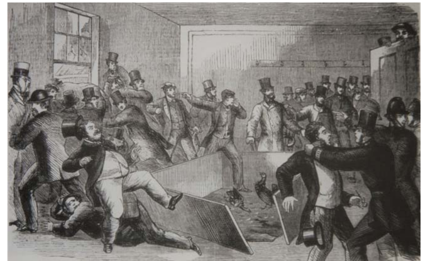
Abb.: Britische Hahnenkämpfe um 1865